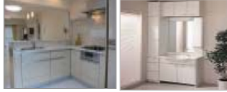
システムキッチン・洗面化粧台