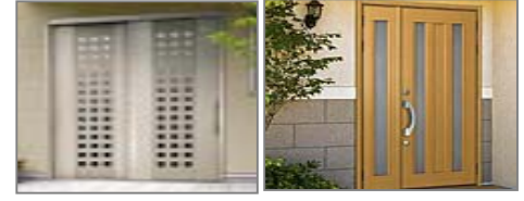
玄関・ドア取替え