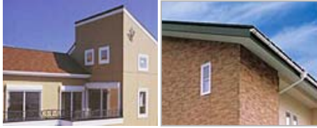
サイディング張替え