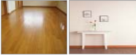
フローリング・天井・壁クロス張替え