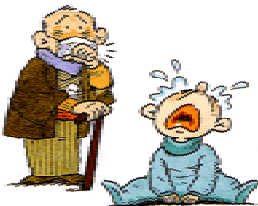
●健康に悪い・環境になる ●家の美観をそこねる